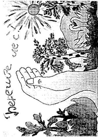
Рисунок Марины Просаловой, 7 класс. с. Корткерос.